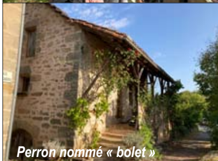
Perron nommé « bolet »

Jeudi étant la journée de repos du chauffeur, nous partons du Centre à pied pour une petite randonnée matinale. Montée à la découverte du moulin de Seyrignac , moulin à vent datant de 1760, restauré par son propriétaire et fonctionnant encore. De beaux petits chemins bordés de murs de pierre et en sous-bois nous accompagnent toute la matinée.