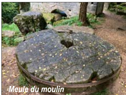
Meule du moulin