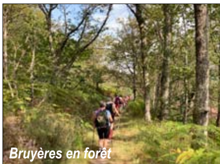
Bruyères en forêt

En ce troisième jour, les deux groupes partent de Cardaillac . Le paysage est différent des deux jours précédents : déambulation plutôt en forêt offrant tapis de bruyères, fougères et petits ruisseaux. Rencontre avec des brebis caussenardes du Quercy reconnaissables à leurs yeux cerclés de noir et leurs oreilles noires.