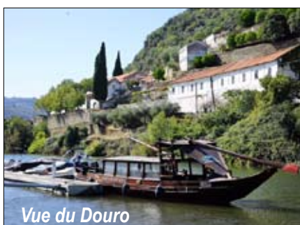
Vue du Douro