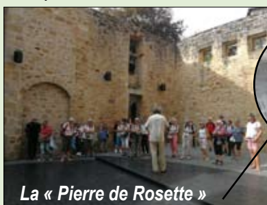
La « Pierre de Rosette »