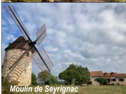
Moulin de Seyrignac