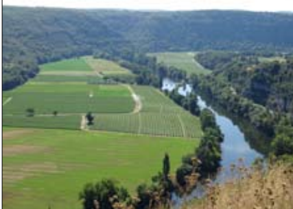
Château de Laroque-Toirac