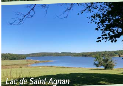
Lac de Saint-Agnan