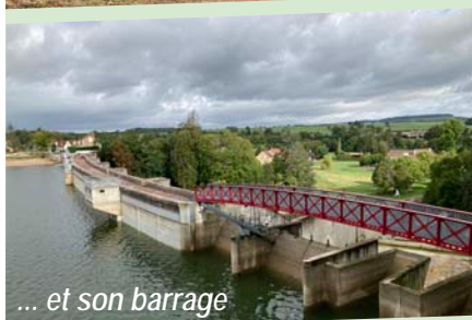
... et son barrage