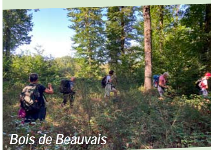
Bois de Beauvais