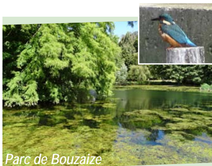
Parc de Bouzaize