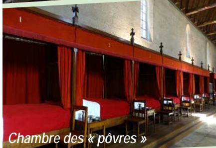
Chambre des « pòvres »