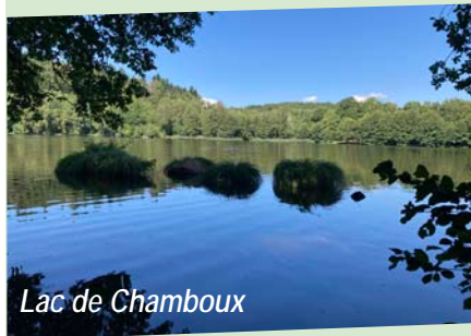
Lac de Chamboux