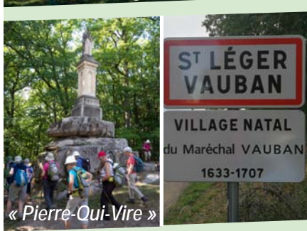
« Pierre-qui-Vire »