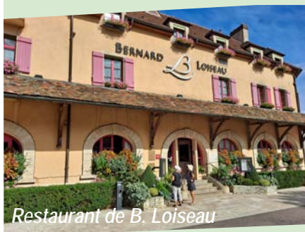
Restaurant de B. Loiseau

La prière et le travail rythment la vie des moines bénédictins, qui, par ailleurs, accueillent des retraitants tout au long de l'année.