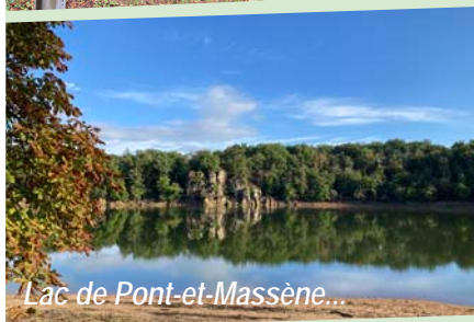
Lac de Pont-et-Massène...