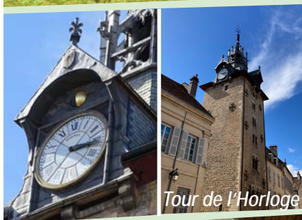
Tour de l'Horloge